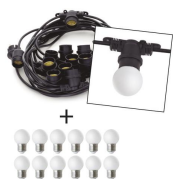
Portofino Kit Opal