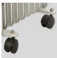
Ruedas para transporte