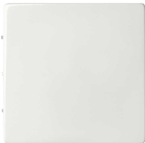
Vista frontal tecla Simon 82 blanco