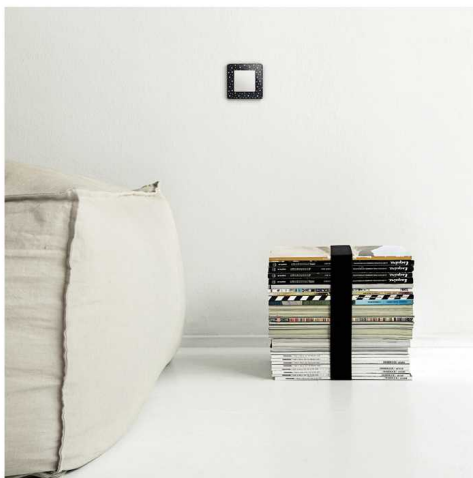
Aplicación tecla blanco en dormitorio