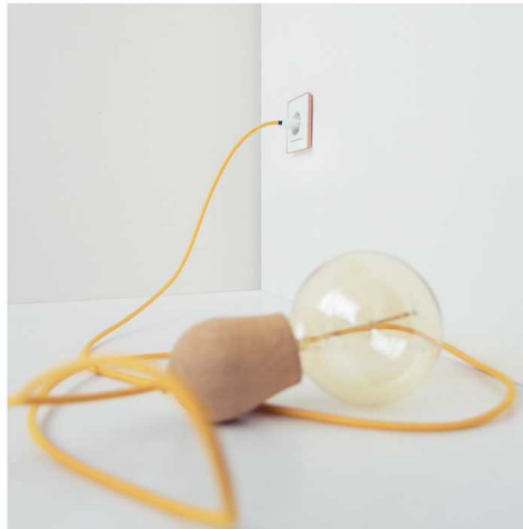
Aplicación base de enchufe schuko en mesa