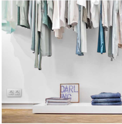
Aplicación base de enchufe schuko en vestidor