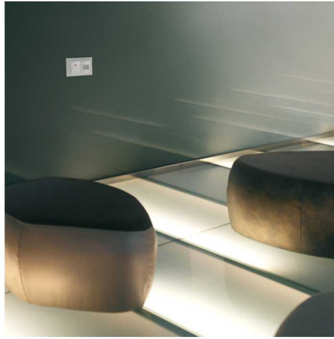
Aplicación conmutador en hotel