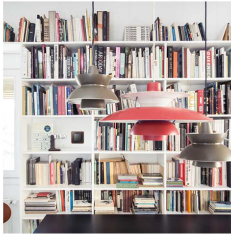
Aplicación conmutador en sala de estudio